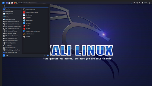
Figura 5: Kali Linux un distro para los profesionales de ciberseguridad con todas las herramientas