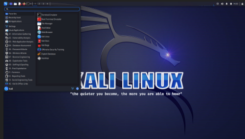
Figura 5: Kali Linux un distro para los profesionales de ciberseguridad con todas las herramientas